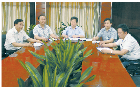
团结奋进的医院领导班子