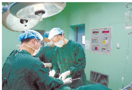
医护人员精心为患者做手术