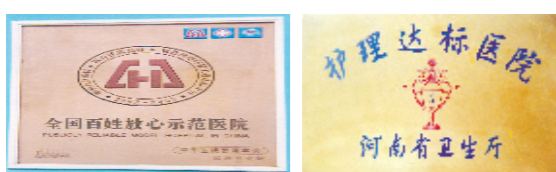
医院取得的部分荣誉